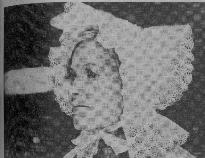
Plumeti y raso para la mujer que vuelve al romanticismo.

Sombreros del siglo XVIII en las calles de Londres