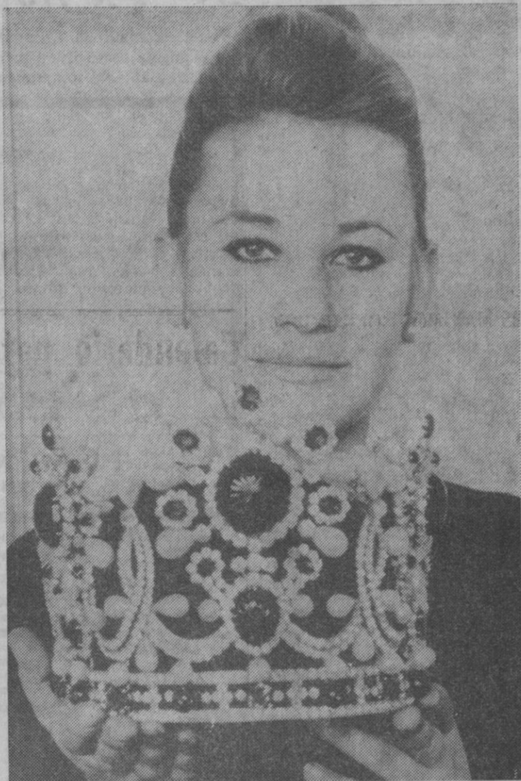
Paris.—Ha sido presentada por los célebres joyeros parisinos Van Cleff y Arpels la corona que lucirá la emperatriz Farah del Irán el día de su coronación, el próximo día 26 de octubre en Teherán. Consta de mil seiscientos cuarenta y seis piedras preciosas, pesa un kilo seiscientos gramos, tiene veintinueve centímetros de diámetro y las piedras son: mil cuatrocientos sesenta y nueve brillantes, treinta y seis rubies, treinta y seis esmeraldas y ciento cinco perlas.