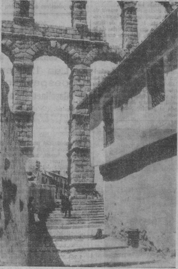
También esto era importante