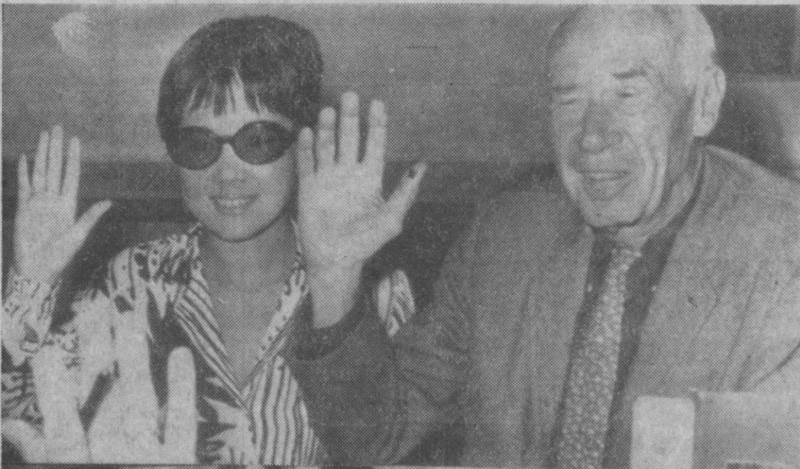
Santa Mónica (California).—El autor Henry Miller, de setenta y cinco años, y la pianista japonesa Hoki Tokuda, durante el momento de solicitar la licencia matrimonial en Santa Mónica, California.

En el transcurso de dichas visitas, los componentes de la mesa vienen planteando de forma documentada y planteando de forma precisa, con la urgencia que el caso precisa, las exigencias y aspiraciones sobre las que en estos momentos están pendientes los trabajadores españoles.—Cifra.