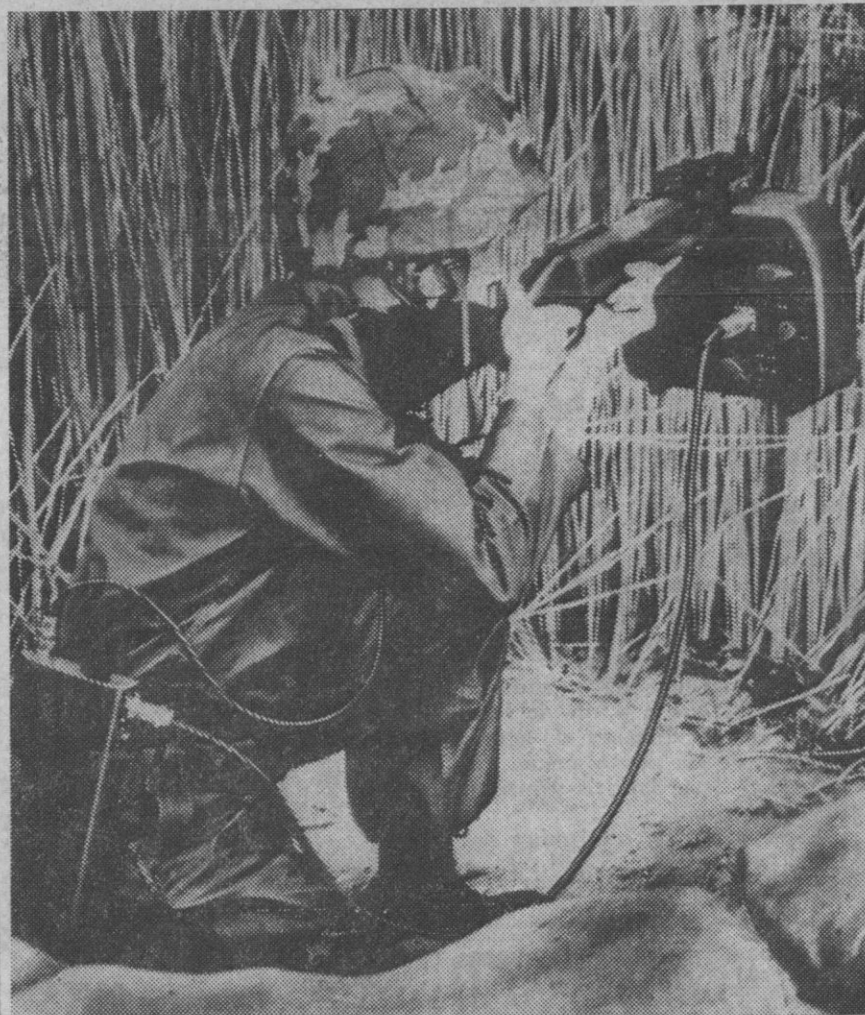
El Ejército norteamericano experimenta actualmente para sus combatientes en la jungla, un fusil equipado de «orejas electrónicas» que permiten al tirador advertir o detectar la presencia de los enemigos. El ruido que el adversario produce al desplazarse es rápidamente captado con este sistema. Este arma será muy útil para combatir en la jungla y por la noche, dado que la vegetación camufla al enemigo fácilmente.

La orden de nacionalización de la citada filial, la «Detersav-Algerie», es de 13 de septiembre y ha sido firmada por el presidente Bumedien. Dicha orden dice que el Gobierno pagará las correspondientes compensaciones por la nacionalización.