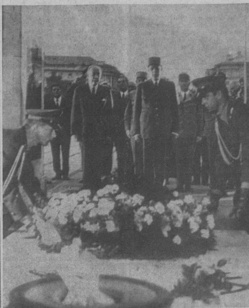
Varsovia.—El presidente francés, general De Gaulle, durante la ceremonia en la que ofreció una corona de flores ante la tumba del Soldado Desconocido de esta capital.

El acto se celebró en el salón Goya del Ministerio y asistieron los dos subsecretarios, directores generales y altos jefes del departamento.—Cifra.