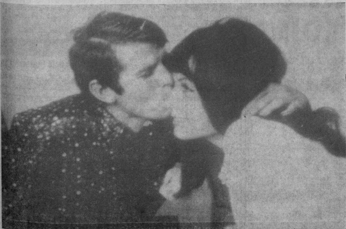
Aranjuez.—Manuel Benítez «El Cordobés», besa cariñosamente la mejilla de la estrella cinematográfica italiana Maria Grazia Buccella. La estrella visitó al diestro antes de presenciar su actuación en el ruedo. La estrella junto con Yul Brimer y Robert Milchun, ruedan actualmente en España el film «Villa cabalga».

La orden se debe a una petición de la Secretaría de Estado de Estados Unidos, que considera el viaje quijotesco, peligroso y que daría una victoria a Fidel Castro en la guerra de propaganda que ambas naciones realizan.—Efe.