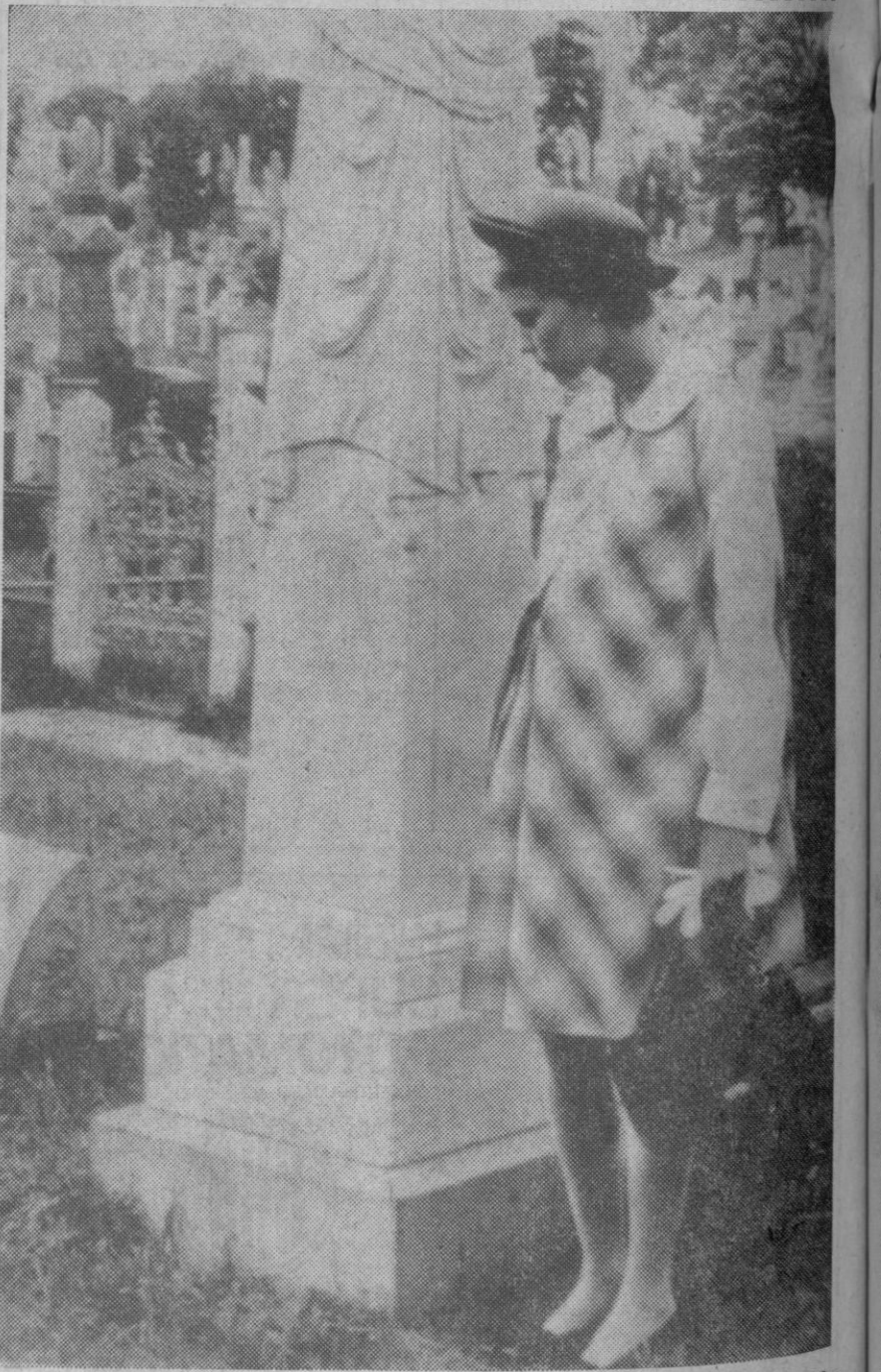
Mia Farrow Sinatra quiere llegar a ser una gran estrella, y precisamente ahora empieza a encontrar un lugar en el firmamento de Hollywood, bajo el consejo y la estrecha dirección del director polaco Román Polanski.

Barcelona, 6.—Gina Lollobrigida, correspondiendo a la invitación que le cursó el Comité organizador del X Festival Internacional de la Alta Moda en Piel, asistirá a la Gran Gala en el palacio nacional de Montjuich.