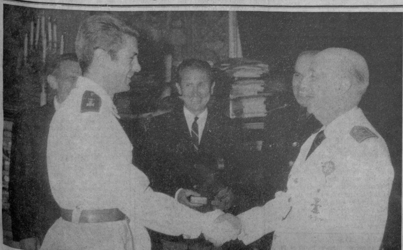
El Pardo.—El Jefe del Estado saluda al nuevo campeón de Europa de boxeo de los pesos ligeros, Pedro Carrasco, a quien acompañan el ministro secretario general del Movimiento, el delegado nacional de Educación Física y Deportes y el presidente de la Federación Española de Boxeo. Franco impuso al nuevo campeón la medalla del Mérito Deportivo.