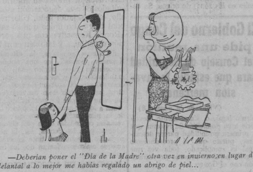
—Deberían poner el "Día de la Madre" otra vez en invierno, en lugar del delantal a lo mejor me habías regalado un abrigo de piel...