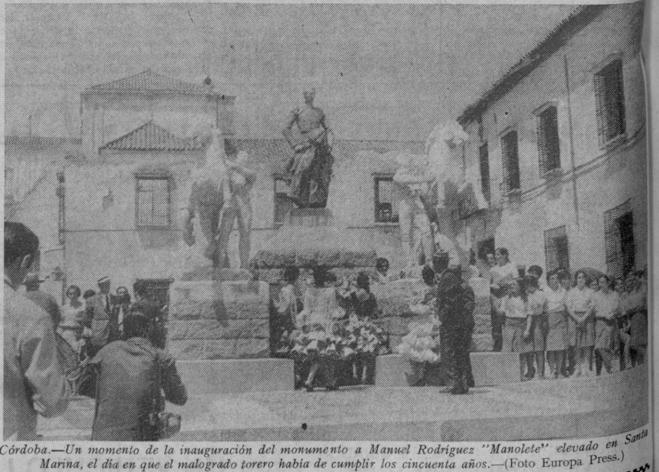
Córdoba.—Un momento de la inauguración del monumento a Manuel Rodríguez «Manolete» elevado en Santa Marina, el día en que el malogrado torero había de cumplir los cincuenta años.

Números premiados en el sorteo extraordinario de la Lotería Nacional celebrado hoy en La Carolina (Jaén): Premiado con diez millones de pesetas el número 12.640. Aproximaciones: 110.500 pesetas para cada uno de los números anterior y posterior al 12.640, agraciado con el «gordo». Premiados con un millón de pesetas, los siguientes números: 40.739 35.595 70.491 45.654 21.702 78.753 57.896 43.757 42.870 44.421. Premiados con 50.000 pesetas los números terminados en: 1.394 y 0735. Premiados con 10.000 pesetas los números terminados en: 162 736 411 387 320 385 250 647 645 278 019 825 551 327 845 502 908 678 958 488 237 215 También resultaron premiados con 20.000 pesetas los números anterior y posterior (aproximaciones) a cada uno de los diez premiados con un millón de pesetas.