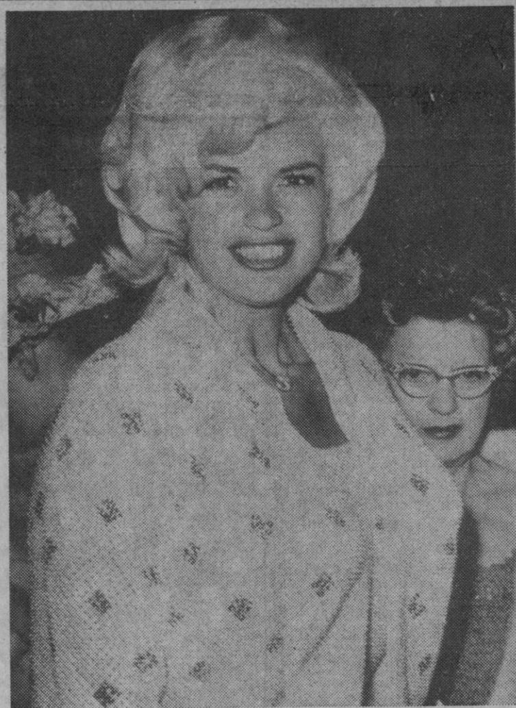
Jayne Mansfield, famosa actriz cinematográfica, que resultó muerta ayer en accidente de automóvil.

Ginebra, 30.—Ocho de los países participantes en las negociaciones de la «ronda Kennedy» se han retirado antes de firmar el acta final. El jefe de la delegación peruana, hablando en nombre de los países en vías de desarrollo, subrayó que la mayoría de los problemas de estas naciones no han sido solucionados en la negociación. El resto, 46, firmaron el acta.—Efe.