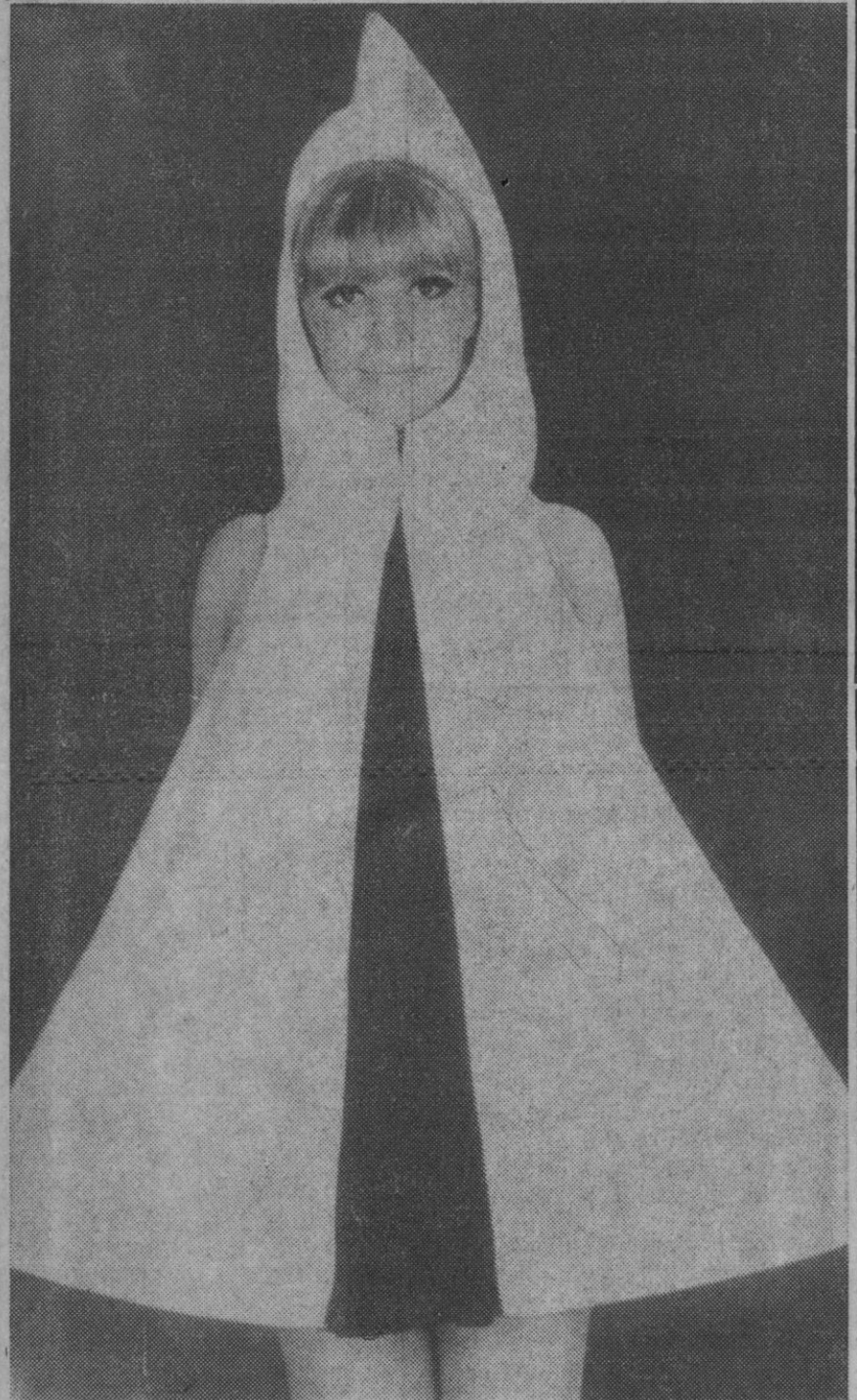
Copenhague.—La línea fue impues- funcional, si no fundamental ni fun- la por París, pero Copenhague se dacional, es el servir para cambiarse ha empeñado en mejorarla. Está he- en la playa. Sus enormes bolsillos cho el traje en auténtico material de pueden contener montones de cosas, tienda de campaña, su "longitud" es como bocadillos, botellas, crema bron- supermini y lleva capucha. La tienda cedora, revistas, sombreros de pla- es en blanco y café con leche. Su uso ya o, trajes de baño.

Después de insistir en esta cualidad de «maestros de la fe», por la que San Pedro y San Pablo dieron su vida, Pablo VI añadió: «Por eso, hijos y hermanos queridísimos, celebramos este nacimiento de la Iglesia en la palabra y sangre de los apóstoles, mediante un explícito, convencido y cordial acto de fe. Un año entero debe llenar nuestras almas este pensamiento y este propósito. Será el «Año de la Fe», el año postconciliar en el que la Iglesia vuelve a meditar en su razón de ser, encuentra su nativa energía, recompone en ordenada doctrina el contenido y sentido de la palabra vivificante de la revelación, se presenta en actitud humillante y amorosa certidumbre a los hermanos que todavía están separados de nuestra comunión y se prodiga por el mundo tal como es, lleno de grandeza y de riqueza y necesitado hasta del llanto del anuncio consolador de la fe. Si estamos convencidos que este nuestro testimonio religioso, nuestra fe, quiere concurrir y censurar el bienestar, a la fraternidad a la paz de todo el mundo. Y bien sabéis lo arraigado que está en nuestro corazón el deseo de que se superen justamente todos los actuales conflictos.—Efe.