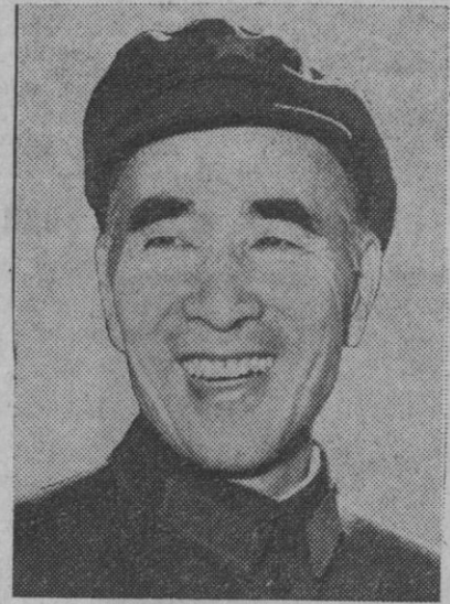
Lin Piao, el ministro chino de Defensa que controla los millones de soldados del Ejército, sobre los que Mao Tse Tung tiene que apoyarse si quiere mantenerse en el poder