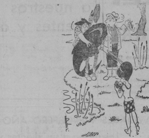
—¿Quieres dejar ya de reír tontamente?

mejor que la realidad 18 meses para pagar Distribuidor exclusivo Casa SOLERA