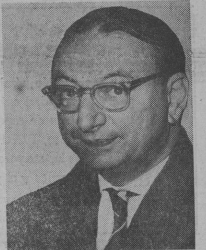
Heinrich Albertz, sucesor de Willy Brandt en el cargo de alcalde de Berlín

Los billetes de Lotería, en el próximo año, estarán ilustrados con un tema común dedicado a la escultura española. El dibujante Miciano ha confeccionado para ello una serie de dibujos, alternando las obras de carácter netamente popular con las de gran prestigio artístico y otras menos conocidas a cuya difusión quiere contribuir la Lotería Nacional.—Cifra.