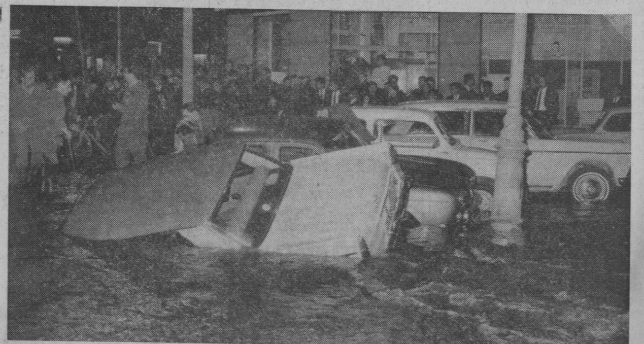
Barcelona.—Los bomberos tratan de sacar del agua varios vehículos aparcados en el cruce de las calles Córcega y Casanovas tras el escape de aguas que produjo el hundimiento del pavimento e inundó una zona de seis metros cuadrados. Varios vehículos quedaron casi sepultados por las aguas.

La dueña al conocer la noticia, cerró el establecimiento por que los dependientes se marcharon.—Cifra.