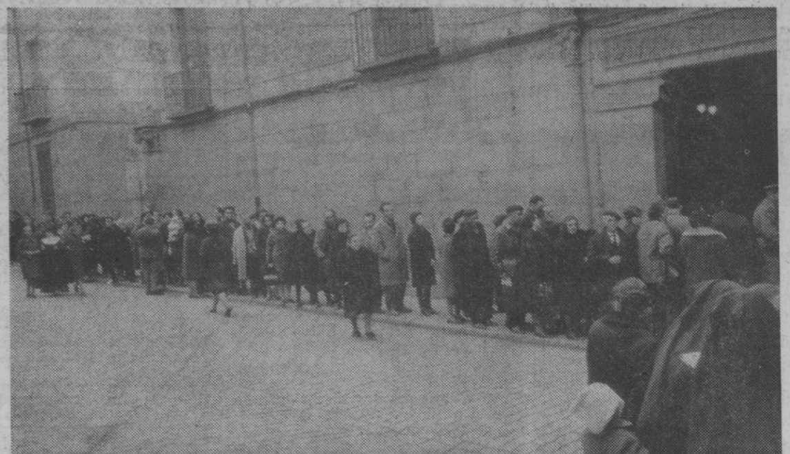
La mesa electoral instalada para transeúntes en la Diputación Provincial, ha registrado una gran afluencia durante toda la jornada, muy especialmente por la mañana. En la fotografía puede verse un aspecto de la larga cola que se ha formado, y que se prolongaba todo alrededor del patio interior del edificio.

Al cerrar nuestra edición (cinco y media de la tarde) la votación en los colegios electorales de la capital alcanzaba el 80 por ciento del censo. En la provincia, el promedio de los distintos pueblos, se elevaba a dicha hora al 85 por ciento. Se espera que hacia las nueve y media de la noche, pueda conocerse un avance de resultado de la votación en Segovia.