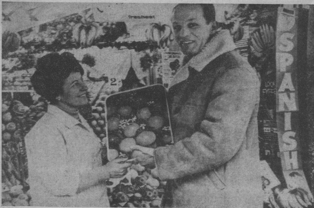
Londres.—Henry Cooper, campeón británico de los pesados, entregando un cestito con naranjas españolas a una cliente de su puesto de frutas.

Los defensores, señores Villa y Rodríguez Quiros, solicitaron sentencias absolutorias, negando la existencia de los delitos imputados.—Cifra.