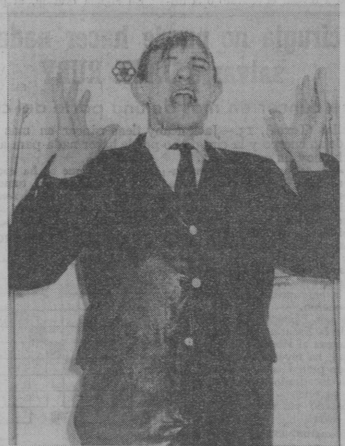
Puede usted estar así diez minutos y después su ropa quedará planchada y como nueva.

En efecto; hay que tener en cuenta que en unos minutos se puede planchar un pantalón y, sin embargo, con el nuevo sistema, es preciso