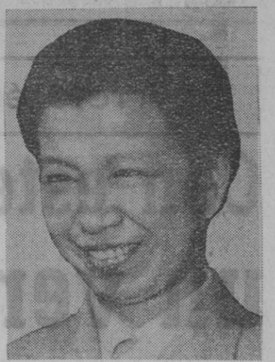
Madame Li Chiang Ching, esposa del presidente del partido comunista chino, Mao Tse Tung, que ha iniciado su actividad por la revolución cultural y ha sido nombrada consejera de la Armada china

Para los Tercios de las Plazas africanas: Crecido haber diario en mano aumentando por años de servicio PRIMAS DE ENGANCHE, comida y masita para vestuario. PERMISOS: cada seis meses, 15 días; cada año, 40 días (según reenganche), y con viajes al punto elegido, abonados por el Estado. Permisos extraordinarios justificados. ACUDID a alistarse al Banderín de Enganche instalado en el Gobierno Militar de la provincia, con la documentación siguiente: MAYORES DE EDAD: Los que manifiesten ser mayores de edad no precisarán documentación alguna. MENORES DE EDAD: Consentimiento paterno, materno o de tutor. Condiciones: Edad, 18 a 35 años. Talla mínima, 1,650 (puede modificarse). Ser soltero o viudo sin hijos. Tropa en filas: Pueden ingresar en LA LEGION por 16 meses, dos o mas años, con haberes legionarios, solicitándolo, por instancia, del General Subinspector de LA LEGION. Extranjeros: En iguales condiciones. INFORMAROS EN LOS AYUNTAMIENTOS Y PUESTOS DE LA GUARDIA CIVIL