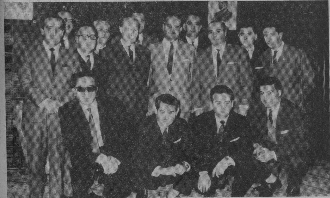
La Junta de Gobierno del Colegio Oficial de Gestores Administrativos visitó ayer nuestra capital, como informamos en página tercera.

En contrapartida, España exportará productos industriales por una cifra aproximada de 34 millones de dólares, según se informa hoy en medios competentes.—Cifra.