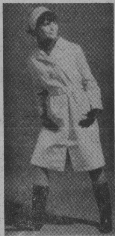
Juvenil impermeable en popelín de algodón, con puñuelo del mismo tejido

Pedro Rodríguez presenta un traje de noche recto, en encaje de algodón