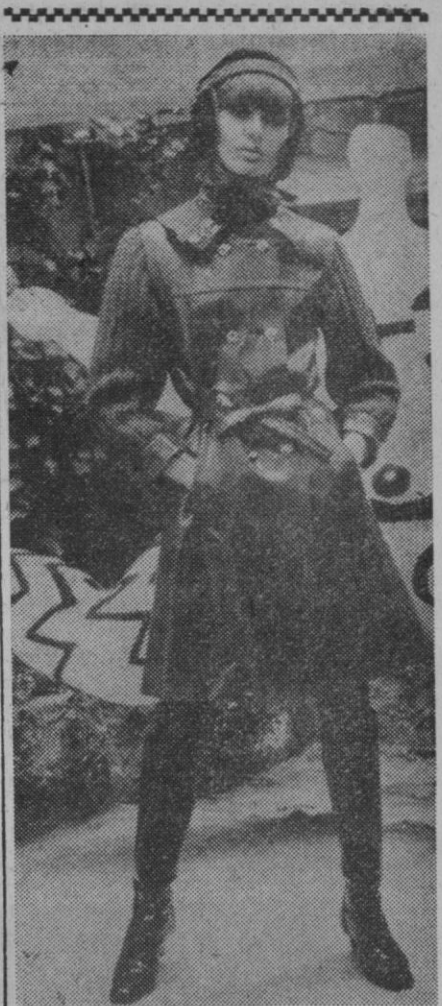
Impermeable rojo al que se acompañan botas y sombrero para sobrellevar los peores días del invierno. De la boutique Saint Laurent's Rive Gauche.

Lino, dos impermeables de algodón uno negro con lunares blancos y el otro estampado, ambos con sombrero a juego. También un precioso traje de novia, en raso de algodón labrado, línea princesa, con cuello y puños de visón y saliendo la cola de las costuras de los lados.