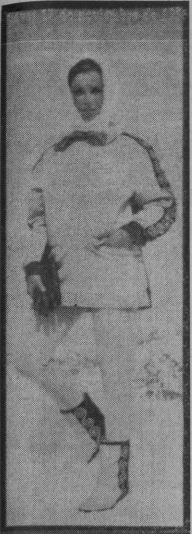
Original conjunto de esquí en grueso algodón, con aplicaciones de bordado en mangas y botas