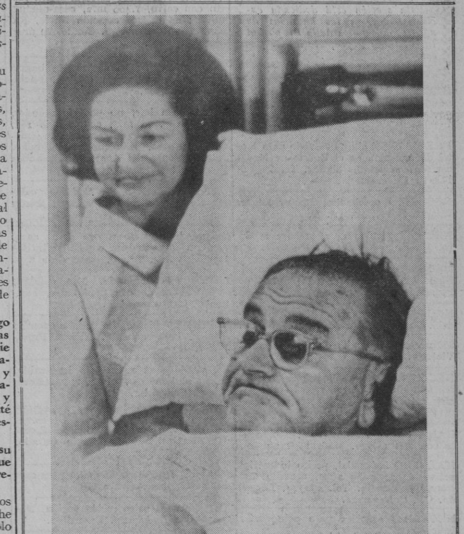
Bethesda (Maryland).—El presidente Johnson descansa un rato después de practicada la intervención quirúrgica, en el Hospital Naval de Bethesda. El presidente tiene en sus manos unos papeles de correspondencia y a su lado su esposa que le vela.

También se confesó autor de tres «go'pes» en territorio francés, a donde había cruzado a nado, clandestinamente, apoderándose de 9.000 francos fuertes, que cambió después en Biarritz, en un coche ambulante de un banco de aquella nación, y por los que se entregaron 85.000 pesetas, que se ha gastado alegremente.—Cifra.