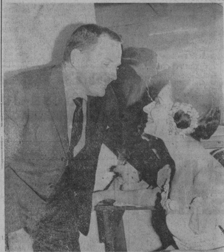
Paris.—Alicia Alonso, la primera bailarina del Ballet Nacional Cubano, sonríe complacida a su esposo después de su actuación en el Teatro de los Campos Elísos de la capital francesa.