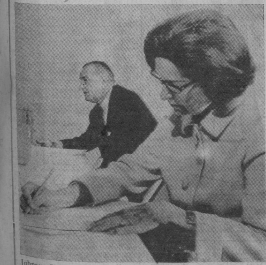
Johnson City (Tejas).—La señora del presidente norteamericano Lyndon B. Johnson, marcando su candidatura electoral en Johnson City, mientras el presidente se prepara para hacer lo mismo

En Belluno, la situación mejora lentamente con la llegada de los primeros socorros, pero la situación de los valles de Agordino, Zoldano y Comélico continúa siendo grave. El espectáculo que la región presenta a los pilotos de los helicópteros es impresionante. Poblaciones enteras están sumergidas bajo las aguas. Los daños establecidos hasta la tarde de ayer superan los 50 mil millones de liras.—Efe.