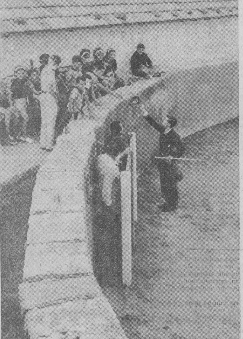
Finca de «El Campillo» (Madrid).—El diestro Palomo Linares brinda la capea de dos becerros a los dieciséis niños seleccionados de la «Operación Plus Ultra». El propietario de un hotel de Madrid invitó a los pequeños héroes a una terna en una finca de su propiedad en El Campillo, a cargo de Palomo Linares, que se ofreció voluntario al espectáculo.—(Foto Europa Press)

La industria automovilística norteamericana ha terminado la fabricación de los modelos de 1966 con un total de 8.611.928. Esta cifra sólo fue superada el año pasado, con una producción de 8.849.032.—Efe.