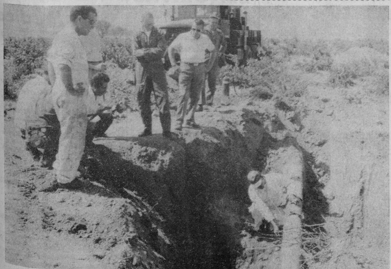
Zaragoza.—En la partida de «Los Reinos», del término municipal de Calatorao se produjo un escape en el oleoducto Rota-Zaragoza, que rápidamente es reparado por técnicos americanos llegados de Sevilla.

La reunión que comenzó a las once y media de la mañana, se suspendió a las 2,30 de la tarde para continuar a las 5,30.—Cifra.