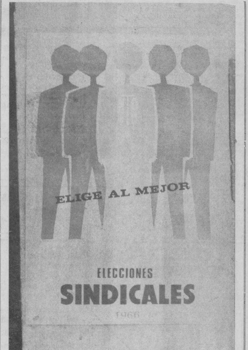
Ha comenzado el periodo electoral sindical. La última semana de este mes se celebrarán las elecciones para enlaces sindicales y vocales jurados. En nuestra provincia resultan afectadas quinientas empresas. He aquí uno de los carteles anunciadores de estas elecciones

Madrid, 6.—El ministro de Hacienda, don Juan José Espinosa, ha salido esta mañana para San Sebastián, por carretera, con objeto de asistir al próximo Consejo de ministros.