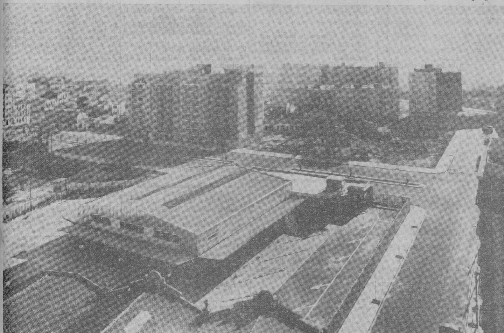
Una vista de la Estación Sur de Autobuses, construida en Valencia

de la ciudad. La rentabilidad de los locales comerciales que se levantan sobre el suelo, y la tasa por uso de utilización de los garajes del subsuelo, compensarán los posibles déficits de explotación de la Estación, en cuyos cálculos no puede entrar el ánimo de lucro por inspirarla una clara idea de servicio, en favor sobre todo de quienes salen o diariamente llegan a Segovia para honrarnos con su visita, que son los más por este medio de transporte, dado el poco kilometraje del ferrocarril en la provincia, visitantes o vecinos a los que mantenemos sometidos a las inclemencias de nuestro duro clima por no disponer de esa Estación de Autobuses, que como servicio a la ciudad debe ofrecerles, aunque ello no suponga una