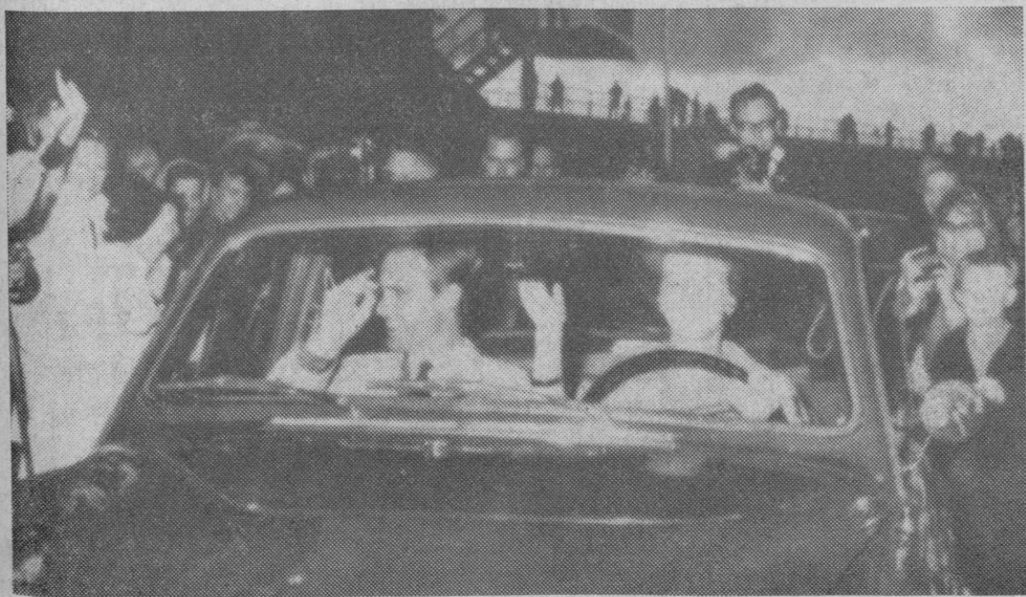
Copenhague.—La princesa Margarita de Dinamarca y su prometido, el conde francés Henri de Monpezat, son aplaudidos por la multitud a la salida del aeropuerto de la ciudad

Uno de los guardianes del depósito de equipajes logró capturar al escarabajo y colocarlo nuevamente en la caja, en espera de que sea retirada la valiosa mercancía.—Efe.