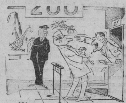
—¡No insista... detesto los cacahuetses...!

Antes de comprar un FRIGORIFICO Vea un Westinghouse en CASA SOLERA Modelo 210 litros, sin entrada a 523 pesetas almes