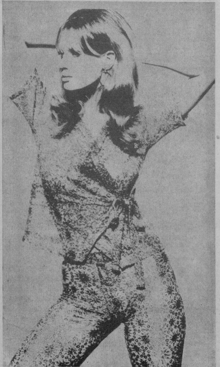
¿Se atrevería usted a vestir así? Con este provocativo título un diseñador francés ha lanzado modelos como el de la foto. A continuación se ofrecen una serie de explicaciones para convencer a las clientas de que es preciso hacerlo para estar al día.

Benidorm, 7 (urgente).—La Policía española detuvo anoche al súbdito alemán Waldemar Wohlfahrt, de 25 años de edad, conocido por «el vampiro de la autopista», y presunto autor de la muerte de tres muchachas en la autopista de Munich a Karlsruhe.—Cifra.