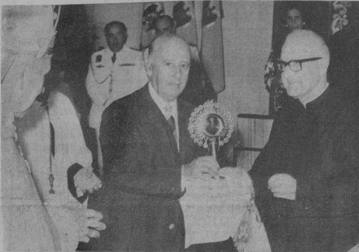
Franco ofrenda al templo expiatorio del Tibidabo la custodia de la Adoración Perpetua con motivo del segundo centenario de la creación del templo.

Barcelona, 7.—En la mañana de hoy S. E. el Jefe del Estado y Generalísimo de los Ejércitos permaneció en el palacio de Pedralbes, donde recibió las siguientes audiencias: Comisión de generales, jefes y oficiales de los Ejércitos de Tierra, Mar y Aire, presidida por el capitán general de la IV Región Militar.