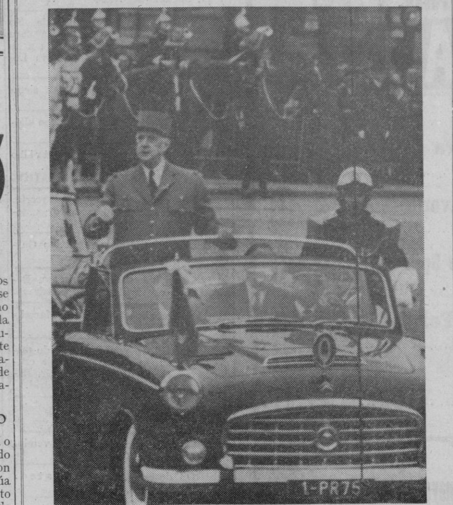
El presidente francés, general De Gaulle, después de asistir al acto celebrado en el Arco del Triunfo, en conmemoración del XXI aniversario de la victoria aliada en Europa, pasa en coche descubierto por los Campos Elíseos, ante miles de personas que le aclaman. (Telefoto AP-Europa.)

El control de avituallamiento de Jaca se efectuó sin otro contratiempo que las malas condiciones atmosféricas.—Alfil.