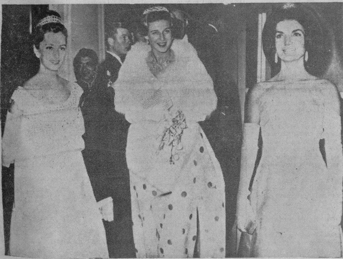
Nueva York.—Entre las diez mujeres más elegantes del mundo, según encuesta celebrada en esta ciudad, han sido seleccionadas la princesa Paola de Bélgica, Alejandra de Kent y Jacqueline Kennedy.

Londres, 20.—Un cerebro electrónico, capaz de seleccionar en cuestión de segundos una entre las miles de fichas con huellas dactilares existentes en los archivos policiales, ayudará de ahora en adelante a Scotland Yard en la captura de los criminales.—Efe.