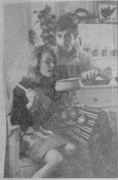
Mayor confort y alegría en la cocina, sobre todo para ellas cuando ellas se ponen el delantal...

Hay quien, con los paños de cocina, han decorado las paredes de la misma. El dibujo y colorido permiten desde luego utilizarlos para la decoración práctica que en un momento dado puede sernos útil. —(Europa Press).