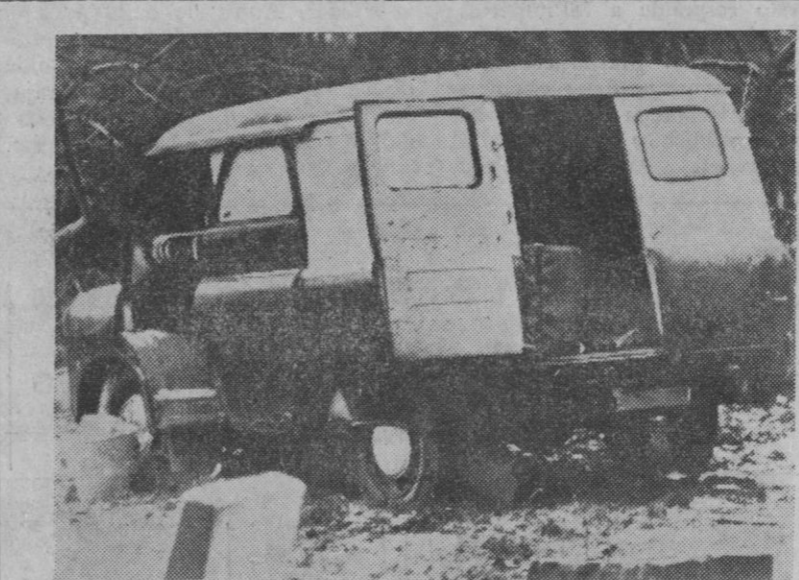
Esta es la camioneta en cuyo interior puede aún verse el baúl donde fue encontrado el cadáver de la niña Laila, de siete años, de Copenhague, bárbaramente asesinada. La policía danesa está realizando activas gestiones para encontrar al sádico asesino