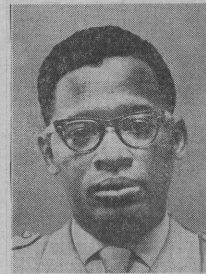
Joseph Mobutu, comandante en jefe de las fuerzas armadas del Congo que, por un golpe de Estado, se ha hecho cargo del poder en el país.

La Historia nos reseña cómo desde entonces, desde el siglo XVIII en adelante, esa reclamación no se interrumpe, con independencia de