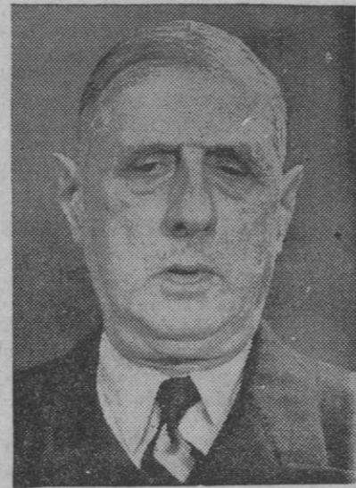
El Presidente de la República Francesa, general Charles De Gaulle, reelegido para un nuevo mandato de siete años

Colombay Les-Deux Eglises, 19.—El presidente De Gaulle, sonriente,