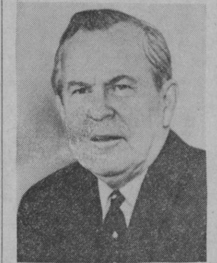
Lester Pearson, primer ministro canadiense, quien después de las elecciones no ha logrado la mayoría parlamentaria que él esperaba.

El Ejército ocupó anoche la emisora nacional de radio de Dahomey.