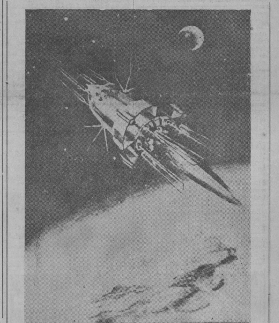
Se celebra actualmente en Moscú una exposición titulada "El espacio visto por un profesor, un artista y un cosmonauta". Este es un dibujo realizado por el cosmonauta A. Leonof, que ha titulado "El Vostok en su regreso a casa".

Madrid, 30.—La obra titulada «El Arte de Cetrería», original de don Félix Rodríguez de la Fuente, recibe el nombramiento de «libro de interés turístico», por resolución de la Subsecretaría de Turismo publicada hoy en el «Boletín Oficial del Estado».—Cifra.