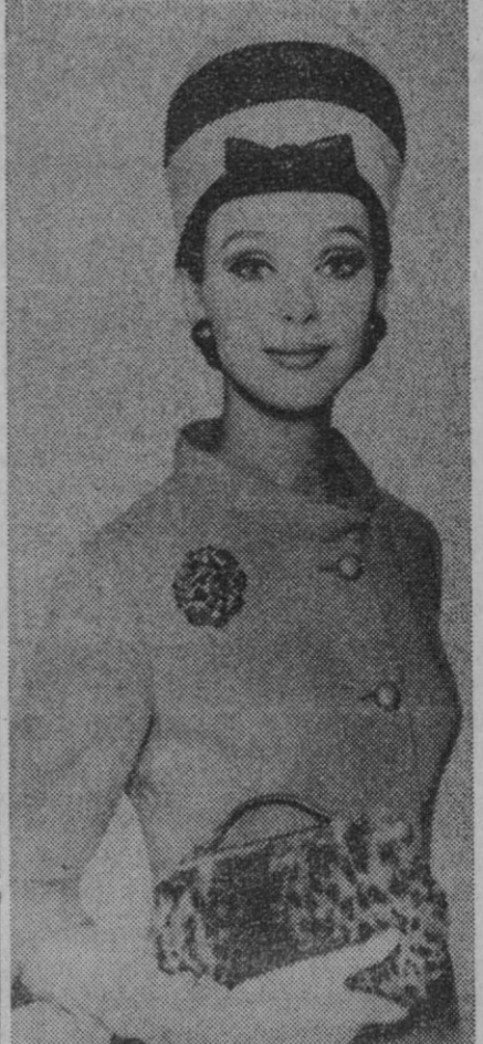
Modelo "Suave".—Sencillez y encanto son las cualidades de este conjunto de color "champagne". El sombrero es de fieltro blanco y negro con ligera visera y lazo de piel.

Las firmas productoras de primeras materias, los tintoreros, tejedores, industrias de acabados y estilistas de modas, han conjuntado sus esfuerzos en perfecta concordancia con los asesores de moda del Instituto Nacional Coordinador de la Moda Española, don Esteban Pila, Maruja Larios y Pilar de Soler, para poder ofrecer las realizaciones creadas para la temporada primavera-verano 1966.