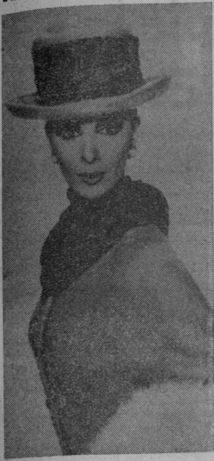
"Bulevar de Paris" es el nombre de este conjunto con verdadera personalidad. No es el modelo en sí lo que produce este efecto si no los accesorios. El pañuelo de seda india anudado al cuello con originalidad y el sombrero de ala recta con adorno de la misma seda y pedrería. La estola es de piel.