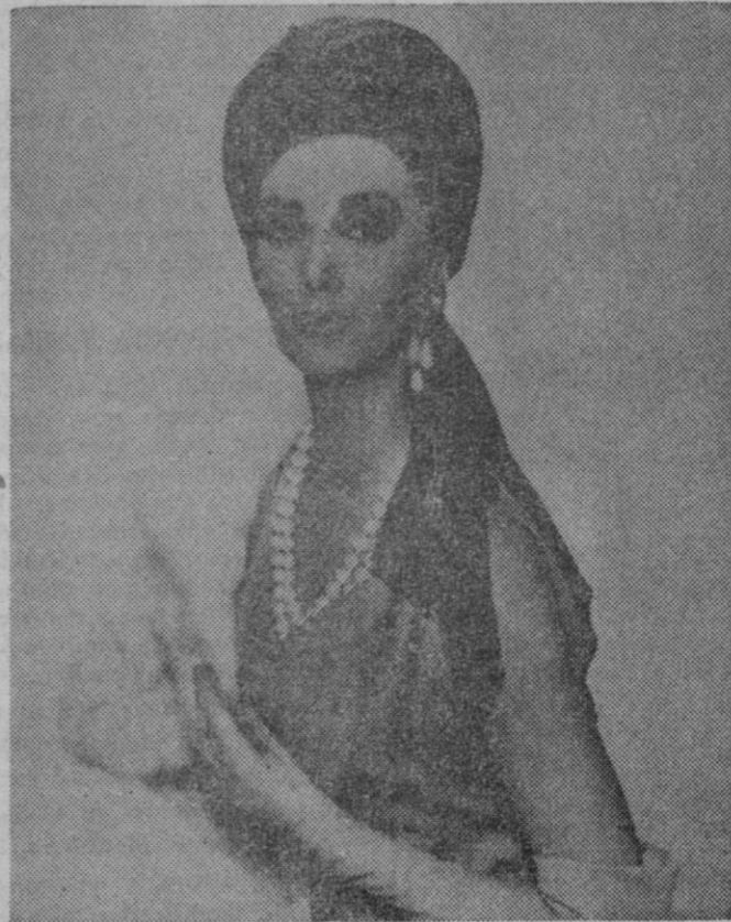
Modelo "Fascinación".—Un elegante traje estilo oriental completado por un turbante de seda natural estampada, echarpe de armiño blanco, pendientes y collar a juego de perlas gordas engarzadas en brillantes.

terinas) tienen otro grave problema: ¿Qué trabajo ha de hacer una mujer que desempeña una limpieza semanal?