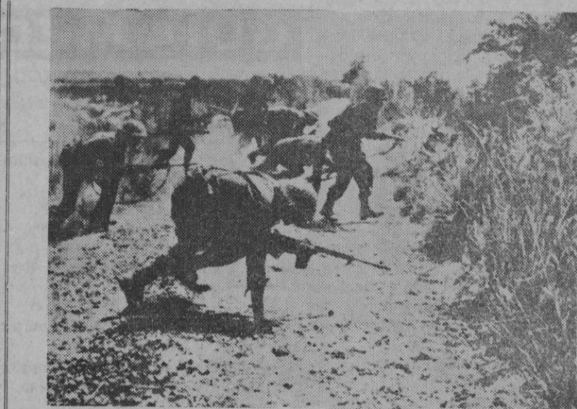
Pequeñas unidades de tropas indias avanzan cautelosamente en una de sus operaciones de ofensiva en territorio pakistani, la sur de Lahore. La fotografía recibida por radio desde el frente de combate, muestra a los soldados preparándose para iniciar un pequeño asalto.

Muzaffarabad (Cachemira pakistaní), 21.—El «Consejo revolucionario» de Cachemira indio manifiesta que no se ve afectado por la resolución del Consejo de Seguridad que ha pedido a la India y al Pakistán que pongan fin a las hostilidades, anunció esta Organización en una emisión de radio captada en Muzaffarabad.