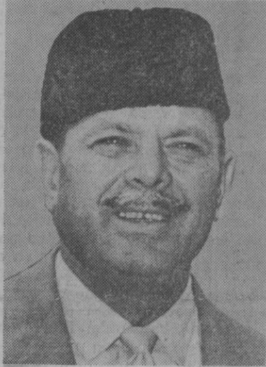
Ayub Jan, presidente de la República del Pakistán

Al mismo tiempo Bhutto dijo que si en un cierto período de tiempo el Consejo no era capaz de resolver el problema básico de Cachemira, Pakistán se vería en el caso de «tener que retirarse de la O. N. U.»