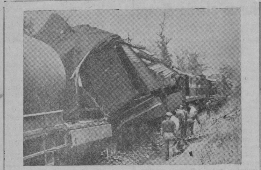
Almería.—A las tres y media de la tarde del lunes, el tren correo Madrid-Almería chocó violentamente con un mercancías que se hallaba detenido en la vía por un corte de fluido eléctrico. Resultaron muertas diez personas y cincuenta y tres resultaron heridas. En la foto, impresionante aspecto de los dos trenes siniestrados.