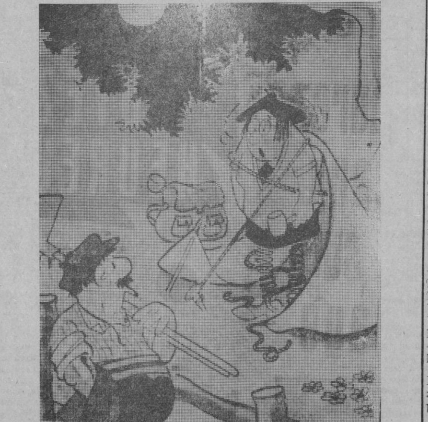
—Oiga, amigo, ¿hay algún buen hotel por aquí?