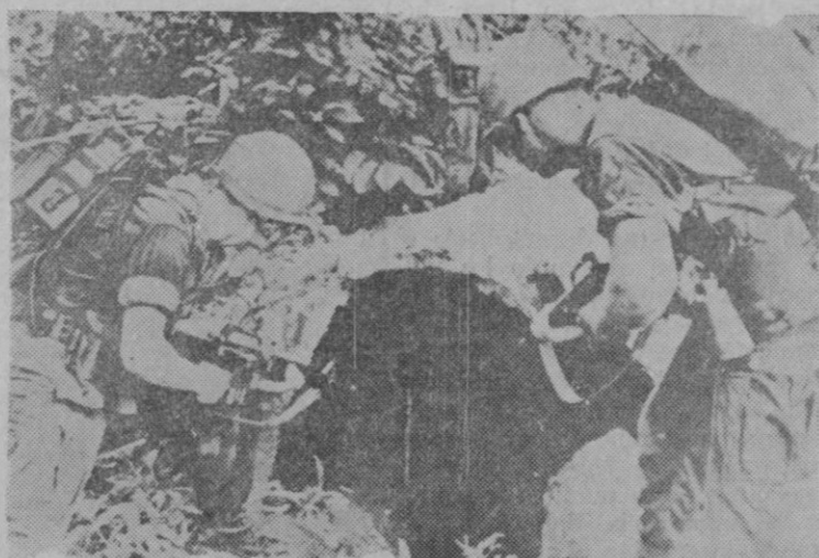
Saigón.—Durante una operación de limpieza de guerrilleros del Vietcong, un grupo de paracaidistas norteamericanos ametrallan el interior de un túnel de la región de Phuoc-Tuy, a sesenta kilómetros al este de Saigón. Los "viets" utilizan estos túneles como refugio y buscar el momento propicio para tender emboscadas.

Después de la entrevista con el presidente Illia, el ingeniero Hagemeyer dijo a los periodistas: «He colaborado en mi juventud en la creación de numerosas armas guerreras, y ahora, con 63 años, me siento orgulloso de trabajar por el bien de la humanidad.—Efe.