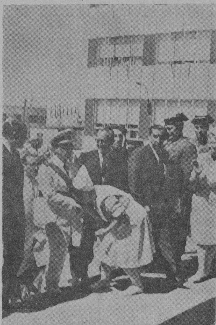
A su llegada a la Maternidad "La Paz", de la Seguridad Social en Madrid, el jefe del Estado Generalísimo Franco, a quien acompañaban su esposa y el ministro de Trabajo, señor Romeo Gorria, fue sorprendido cuando una de las enfermeras del centro, rompiendo todo protocolo, se dirigió hacia él y, conmovida, le besó la mano, momento que recoge la foto.