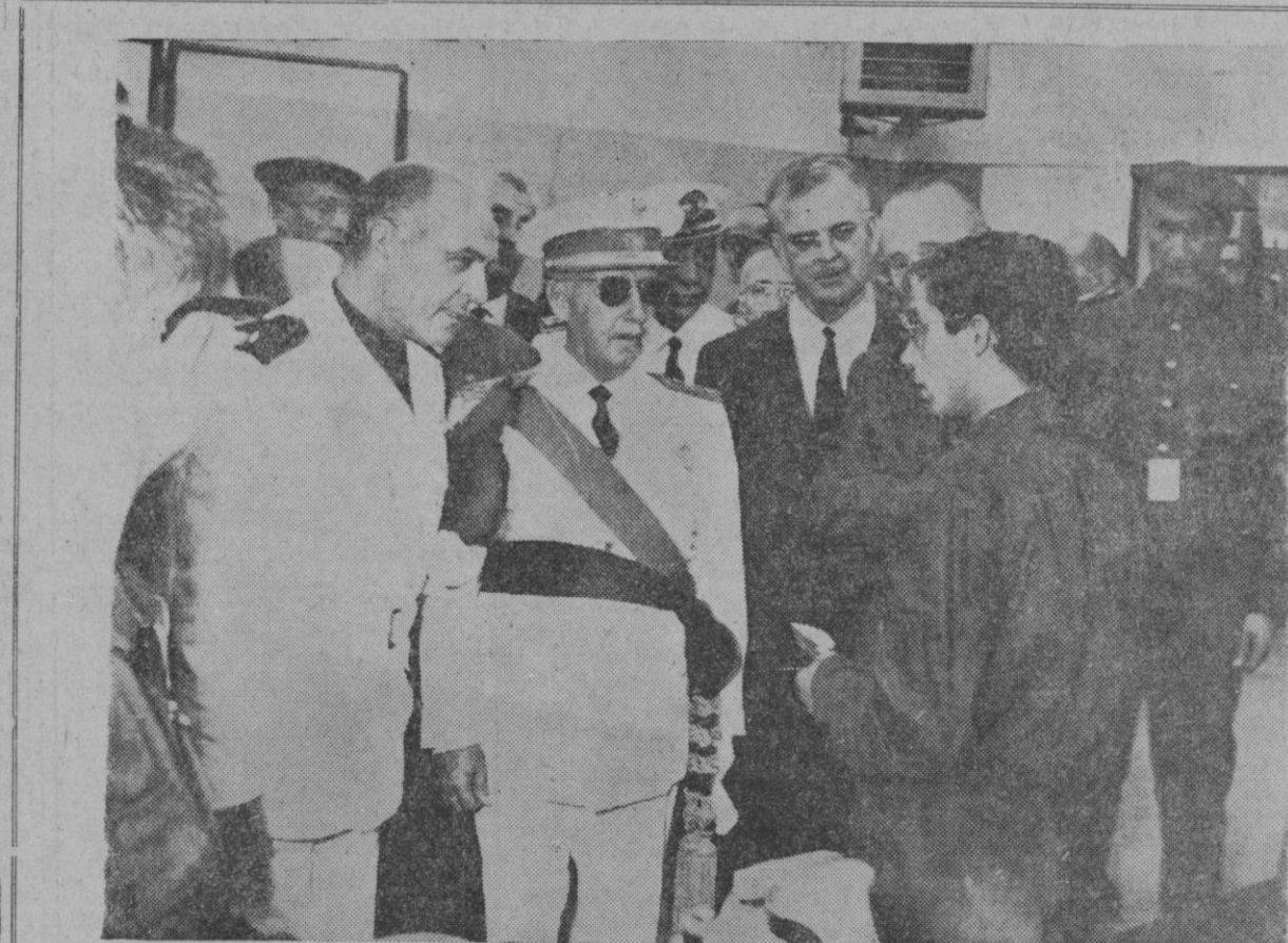
Su Excelencia el Jefe del Estado, Generalísimo Franco, acompañado del ministro secretario general del Movimiento y delegado nacional de Sindicatos, señor Solís, conversa con uno de los obreros del Centro de Formación Profesional Acelerada, en los talleres del mismo, inaugurado por el Caudillo en Madrid, el pasado día 18, en conmemoración del XXIX aniversario del Alzamiento.

Oviedo, 21.—4.716 salmones han sido capturados en los ríos asturianos en esta temporada, cerrada el pasado domingo. La captura por ríos fue la siguiente: Sella, 1.534; Cares, 1.375; Narcea, 870; Navia, 832; Esva, 105.—Alfil.