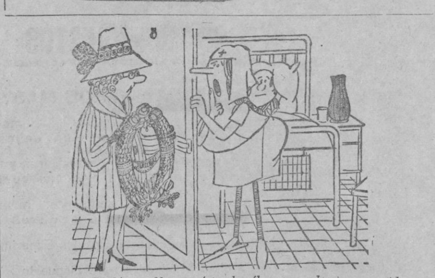
No entendió bien... No son éstas las flores que desea su marido...

MEJOR QUE LA REALIDAD Distribuidor exclusivo CASA SOLERA