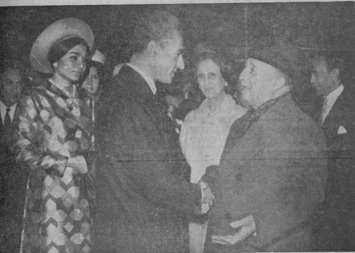
Su Excelencia el Jefe del Estado conversa, en el aeropuerto de Barajas, con el Sha de Persia, que, acompañado de su esposa, hizo escala en Madrid en viaje a Suramérica. Franco acudió con su esposa a saludarles en el aeropuerto madrileño.

Dispensario central: Carretera San Rafael, 3 SEGOVIA