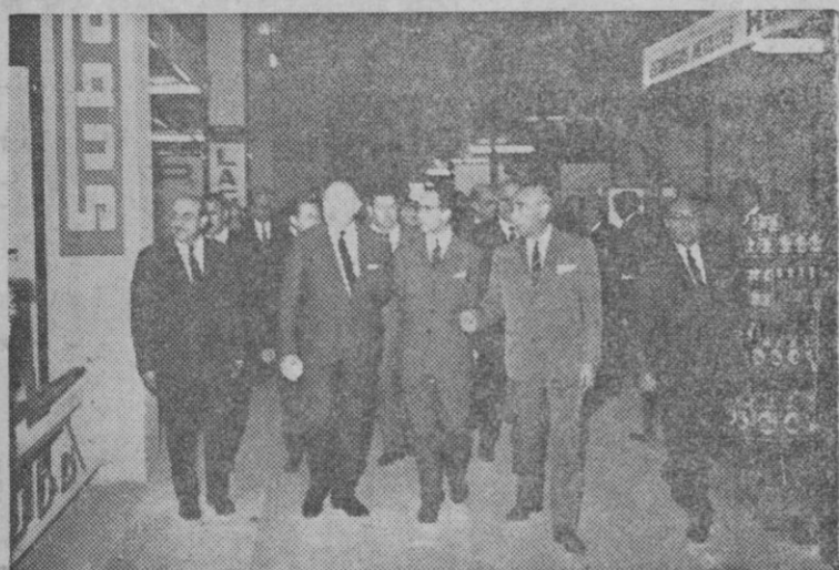
El ministro de Comercio, don Alberto Ullastres, durante su visita a la Feria de Muestras de Valencia, acompañado por el gobernador civil de aquella provincia y el presidente de la Feria.