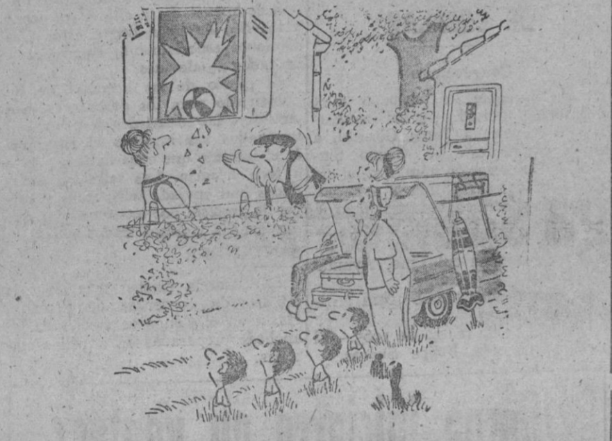
—Mira, acaban de llegar y ya empezamos...

Un regalo adquirido en ATALAYA es siempre portador de la máxima elegancia y calidad. Confíen sus presentes. Fernández Ladreda, 12. Teléfono 2828