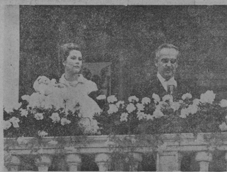
Los príncipes Raniero y Gracia de Mónaco muestran a su hija Estefanía, en un balcón del palacio monegasco, después del bautizo de la pequeña por el cardenal Tisserant.

Roma, 18.—El cadáver del ex-rey Faruk de Egipto ha sido llevado, por orden de la Policía, a un depósito para comprobar las causas que produjeron la muerte del ex-monarca árabe. El fallecimiento tuvo lugar en las primeras horas de la madrugada de hoy, después de haber comido en un restaurante. Un funcionario del hospital donde falleció Faruk ha declarado que estaba seguro de que fue debido a un ataque cardíaco, aunque era necesario comprobarlo.