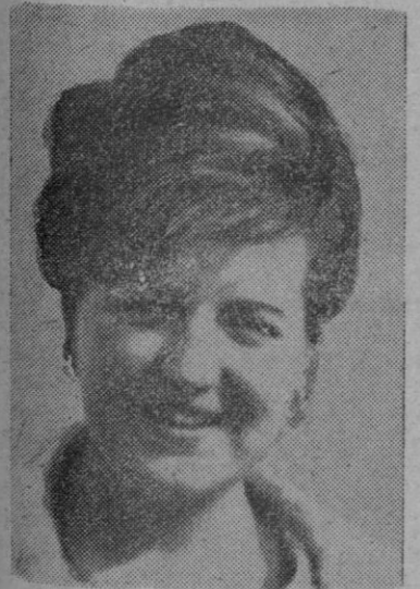
La princesa Margarita de Holanda, hija de la reina Juliana y el príncipe Bernardo, y cuyo compromiso matrimonial ha sido anunciado recientemente

Por orden de la Policía se procedió a abrir la tumba ayer y se ha comprobado que el cadáver de la citada señora no se había sacado de su tumba desde el día de su entierro, el pasado 9 de febrero.—Efe.