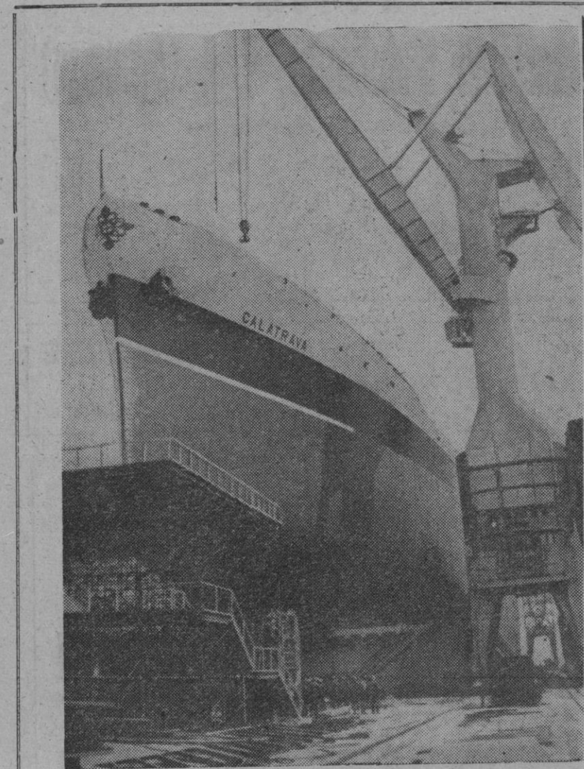
En los astilleros de Cádiz, el casco del petrolero "Calatrava", que con un desplazamiento de peso muerto de 50.375 toneladas, es el mayor construido en España, que fue botado el día 16 de marzo.

Madrid, 17.—Palabras pronunciadas ante Su Excelencia el Jefe del Estado por el ministro de Información y Turismo, señor Fraga Iribarne, como presidente de la Junta Interministerial para la conmemoración del veinticinco aniversario de la paz española: