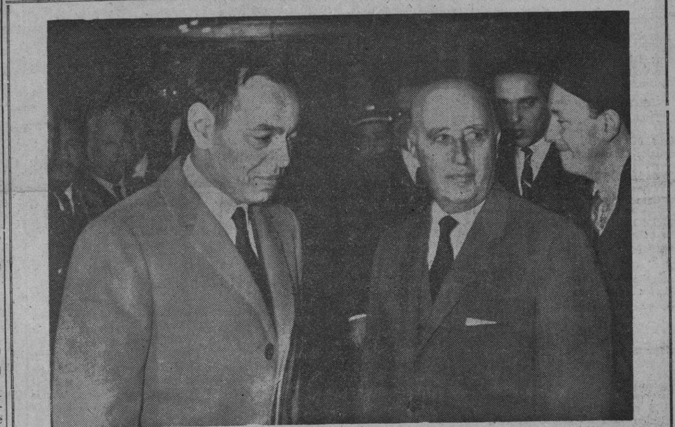
Su Excelencia el Jefe del Estado, Generalísimo Franco, y el Rey de Marruecos, Hassan II, conversan en el parador de La Arruzafa, en Córdoba, durante su estancia en aquella población con motivo de la reciente cacería en que han participado

Su Majestad Hassan II determinó hacer ese donativo, con motivo de la visita efectuada a España, para participar en una cacería organizada por S. E. el Jefe del Estado español, Generalísimo Franco.