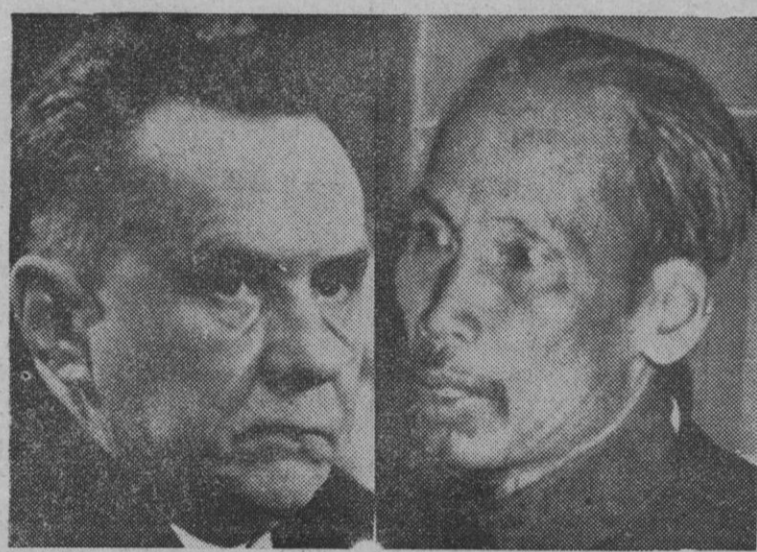
El jefe del Gobierno de la Unión Soviética, Alexei Yosyguin, y el de Vietnam del Norte, Ho-Chi-Minh, que se han entrevistado en Hanoi, la capital del último, mientras los guerrilleros del Vietcong atacaban objetivos norteamericanos en el Vietnam del Sur y aviones de la VII Flota de los Estados Unidos desencadenaban una serie de ataques de represalia sobre el Vietnam del Norte.