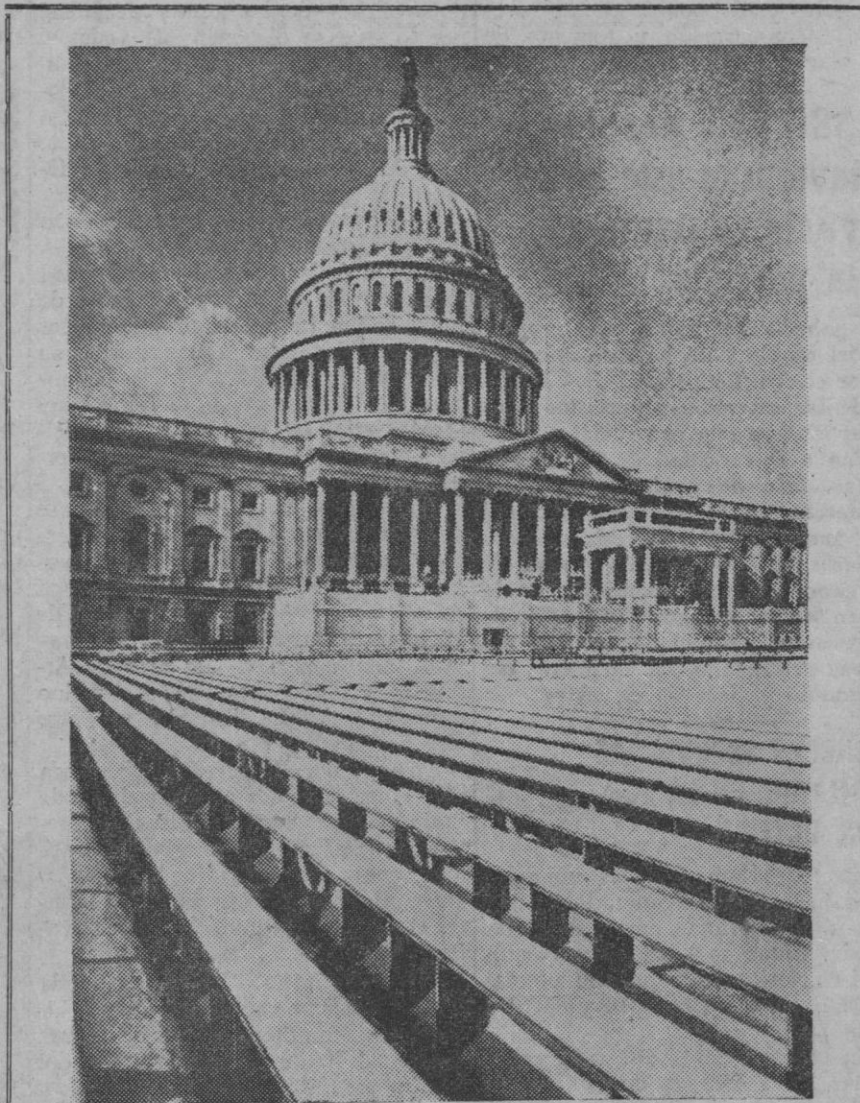
Pocas horas antes de la toma de posesión del presidente Johnson, de los Estados Unidos, los bancos y tribunas preparados para la ceremonia ante el Capitolio de Washington, presentaban este aspecto, cubiertos por un manto de nieve. También su antecesor, Kennedy, contempló un ambiente semejante en su toma de posesión hace justamente cuatro años.

Parece ser que han soslayado el problema de la participación alemana en la fuerza multilateral nuclear, cuyo proyecto es patrocinado por Estados Unidos.—Efe.