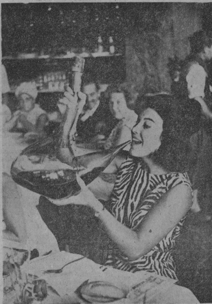
Palma de Mallorca.—A las extranjeras no les asusta tanto como dicen el beber en porrón. Así parece demostrarlo esta belleza que concurre al concurso de las Naciones Unidas. Pese a que el porrón es de dimensiones poco corrientes, la bella no descompone la figura. Al contrario, su postura parece indicar que ya ha recibido bastantes lecciones, aunque se puede asegurar que no tantas como para sospechar que ella se ha bebido lo que falta de vino.

Madrid, 4.—Anoche, la popular actriz y cantante Carmen Sevilla, esposa del compositor Augusto Algueró, dio a luz, felizmente, un niño.