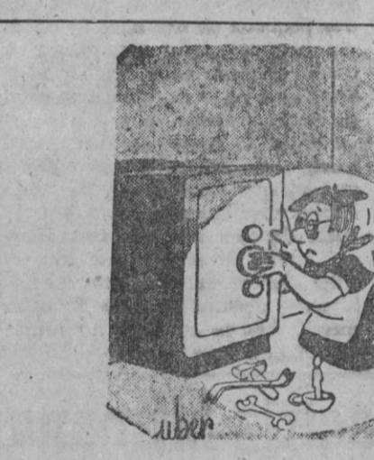
—Cuando quiera un anticipo preferiría que me lo pidiera...

Hogar feliz hogar con AGNI Cocinas butano de venta en Casa Solera