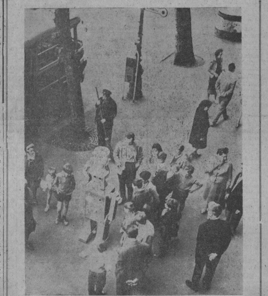
Entre la expectación de grandes y chicos, Ro-Bi Robot se pasea por el bulevar Tanaos de Budapest. Está construido de aluminio, pesa setenta kilos y mide 1,70 metros de altura, y su corazón es una máquina. Roby está muy bien educado y saluda con profundas inclinaciones a los transeúntes. Luego—cumpliendo su función publicitaria—ofrece artículos deportivos, canta y recita poemas.

El vencedor de esta primera etapa ha sido el belgo Sels, que cubrió los 215 kilómetros en 5 horas, 3 minutos y 57 segundos, con bonificación.