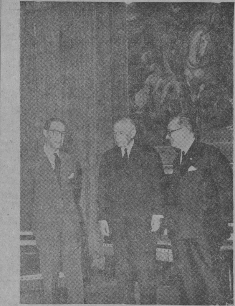
Lisboa.—El ministro español de Comercio, señor Ullastres, durante la visita efectuada al presidente de la República portuguesa, Américo Thomas. Como es sabido, el ministro español, invitado por su colega portugués, Dr. Teixeira Pinto, estuvo en Lisboa para una visita de dos días. El Sr. Ullastres fue recibido en audiencia por el presidente de la República y por el presidente del Consejo, Dr. Oliveira Salazar, y recorrió después las instalaciones de la Feria.

El vecindario de «Cala Gamba» y personal de los hoteles allí radicados, han atendido convenientemente a los pasajeros.