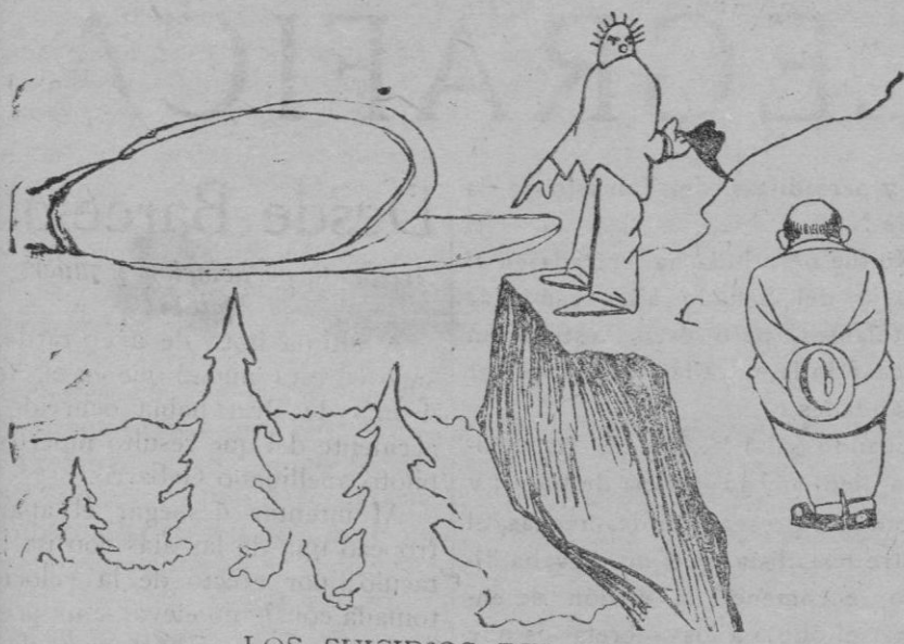
LOS SUICIDIOS DEL DIA

—¡Eh! amigo; ¿a dónde va usted? —Estoy desesperado, y vengo decidido a suicidarme arrojándome por aquí; ¿usted cree que me haré mucho daño?