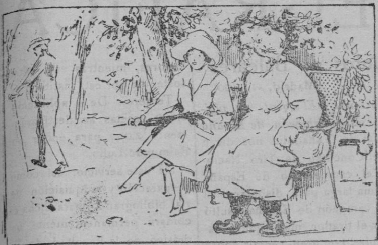
LA NIÑA BIEN

La mamá.—¿Por qué has regañado con Pepito Manzano? La niña.—Porque no es «pera», mamá.