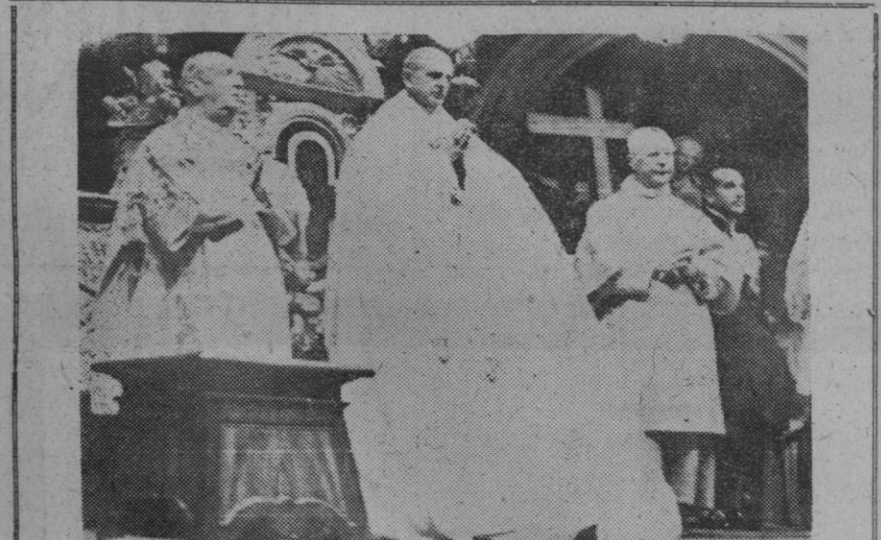
Con toda solemnidad se celebró en la basílica de San Pedro la inauguración de la segunda fase del Concilio Ecuménico Vaticano II. En la foto, un momento de la solemne inauguración por Su Santidad el Papa Pablo VI.

Después de indicar que el frío y la sequía habían afectado a muchas partes de Rusia, calificó la situación de la agricultura como «extraordinariamente difícil».—Efe.