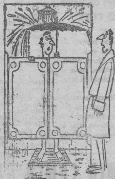
—Adoro la ducha, pero tengo horror al agua.