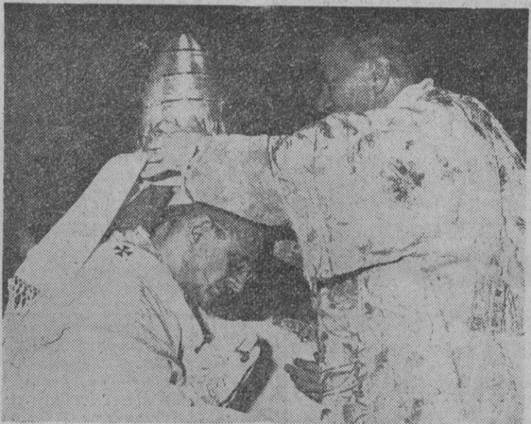
En la foto, el cardenal protodiácono Ottaviani en el momento de colocar la tiara (regalada por los fieles de Milán), a Paulo VI en el momento de su coronación papal.

Este último, que padece parálisis infantil, se hallaba jugando en las riberas del río Segura y al intentar alcanzar un cubo cayó al agua. La corriente del río es muy rápida y otros pequeños no se atrevieron a lanzarse al agua por temor a perecer ahogados. Luis se arrojó vestido y logró asir a José y extraerle con vida.—Cifra.