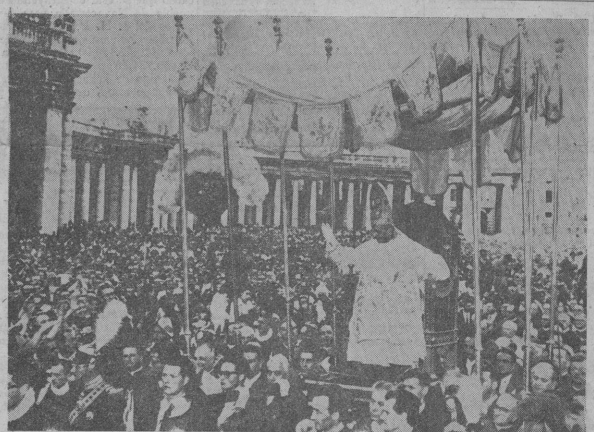
Cerca de medio millón de personas llenaron la plaza de San Pedro para asistir a uno de los más imborrables y solemnes actos que se pueden contemplar: la coronación del nuevo Papa. En la foto, un aspecto de Su Santidad en la tarde de su coronación.

Ciudad del Vaticano, 4.—«El Papa ha recordado a todos las posibilidades y la necesidad de una contribución concreta a la comprensión mutua, a la caridad y a la paz entre las clases sociales y las diversas razas, a fin de que en todo el mundo arda la llama de la fe y del amor», ha declarado Radio Vaticano, al referirse a los diez primeros días de pontificado de Su Santidad Paulo VI, caracterizados por importantes audiencias. La emisora ha añadido: «La figura de Paulo VI empieza a delinearse, y ya se vislumbra su acción futura, una acción que se simboliza en el nombre de Paulo, «apóstol de los gentiles».—Efe.