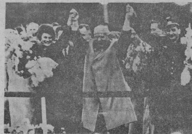
Nikita Khrushchev con la primera mujer del espacio, Valentina Tereshkova, y el coronel Valery Bykovski, en el recibimiento oficial a los astronautas rusos en la plaza Roja de la capital soviética. Khrushchev dijo que el Gobierno ruso intenta levantar una estatua a la astronauta Tereshkova en Moscú, para conmemorar su primer vuelo, y añadió: "El nombre de Valentina quedará en la historia para siempre".