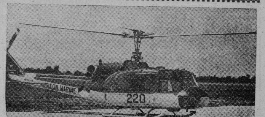
Este helicóptero es la versión italiana del norteamericano Bell HU-1B "Iroquois", que utilizan en gran escala las fuerzas armadas de los Estados Unidos, y que ahora va a utilizar la flota holandesa. Desarrolla 1.050 c. f. en el eje. Dichos aparatos, con motor británico, son utilizados ya por los Gobiernos de Italia y de Suecia, y por compañías civiles de Noruega e Italia.

Moscú, 2.—Francia y la U. R. S. S. han firmado un acuerdo comercial, de tres años, que prevé un aumento en el intercambio comercial de un diez a un quince por ciento, según se ha revelado en círculos diplomáticos franceses de esta capital. El acuerdo abarca a los años 1963, 1964 y 1965.—Efe.