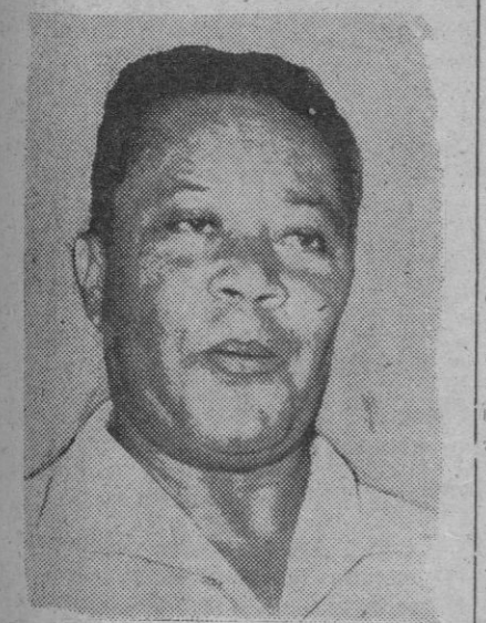
Nicolás Grunitzky, presidente y jefe del Gobierno de Togo, que sucede a su cuñado Olimpio, asesinado recientemente