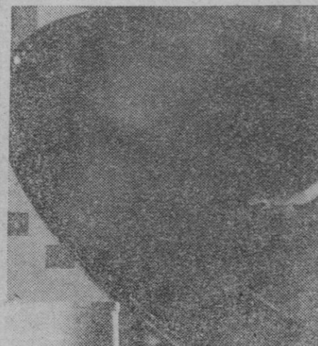
Esta encantadora señorita aparece en el centro de un visitante de acero inoxidable hecho para una fuente pública ornamental, al visitar la reciente Exposición de Ingeniería Química y del Petróleo, en Londres.

designados en principio el presidente del Consejo de Administración del nuevo banco, el secretario y el director general, y que dichas tres personas unen a sus conocimientos una gran juventud.