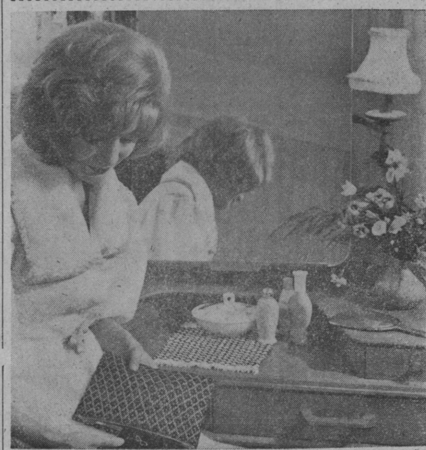
Una firma británica ha adoptado la fórmula de utilizar la artesanía tradicional con materiales modernos para producir una nueva serie de artículos tejidos a mano, llamados «Kent Cottage». Esta señorita examina una almohadilla de maquiñaje, de gran duración, lavable y de atractivos colores, que ha sido confeccionada con tiras de plástico. Este material de cloruro de polivinilo se suministra en estrechas tiras de colores contrastantes entre sí, las cuales se tejen para producir un tejido de ligamento colado de atractivo aspecto.

Se trataba de un señor que con su yerno formó la sociedad mercantil Apícola Comercial, S. L., y realizó intensa propaganda de ámbito nacional ofreciendo doce kilos de miel al año o el importe de su valor en dinero por cada inscripción de mil pesetas. Así logró recaudar hasta once millones. A los primeros vencimientos los anuales iba pagando los intereses prometidos con lo que recibía nuevos suscriptores, pero después no hubo más miel ni dinero. Y cualquiera que se le daba la pena que recaiga sobre el estafador, de poco consuelo va a servir a los que en sus manos depositaron esos ahorros, pues para indemnizarlos en esos once millones de pesetas sólo se cuenta con las dos mil cuatrocientas pesetas que valió un tresillo, sacado en su día a pública subasta.