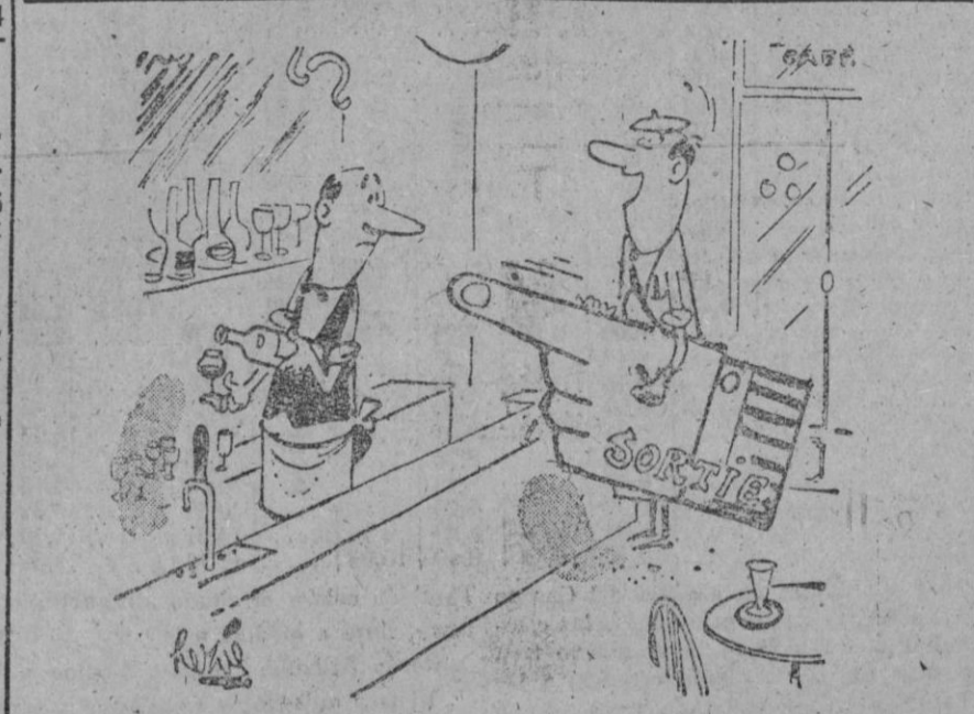
—Ahora su ronda, basta también con un dedo.

Más capacidad - Menos precio - CASA SOLERA