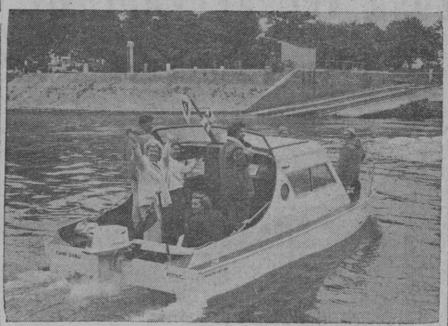
Otra embarcación de recreo, con dieciocho caballos de potencia y que puede desarrollar una velocidad de doce millas por hora