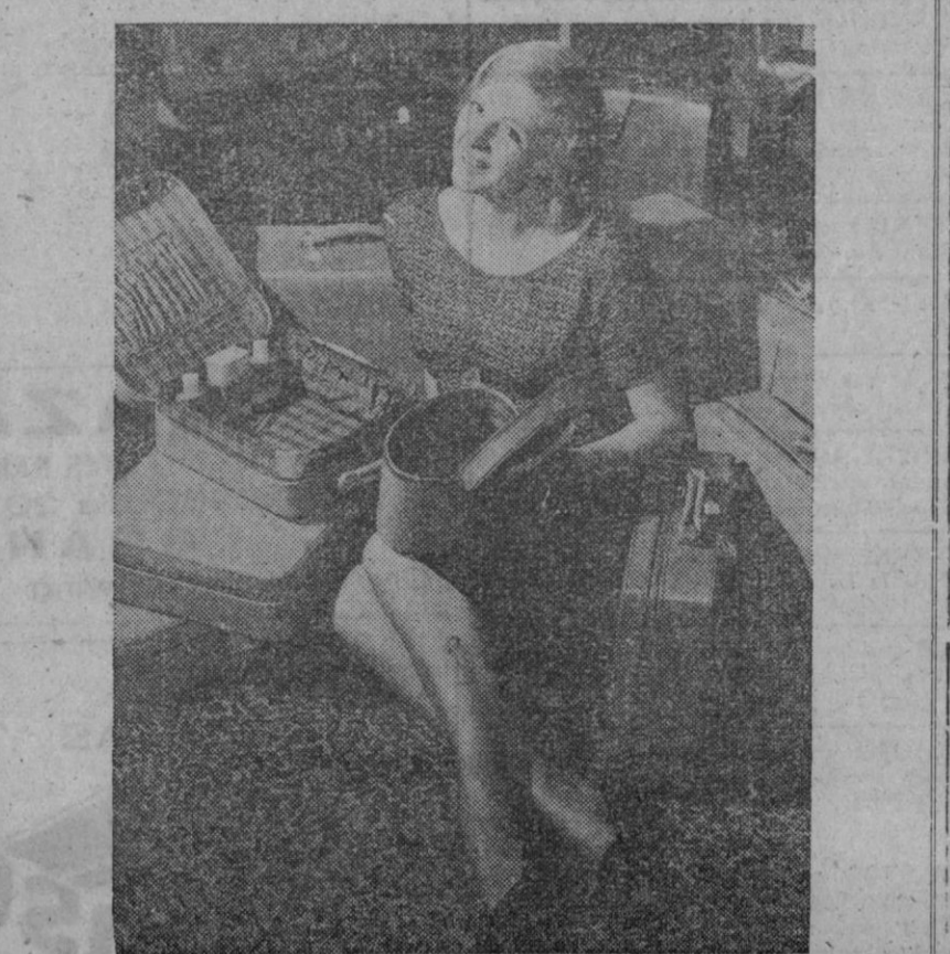
Este elegante juego de maletas de cuero, recientemente exhibido en la Feria de Industrias de Artículos de Cuero celebrada en Londres, figura también en la Feria de Muestras Británica, que a principios de mayo se inauguró en Estocolmo

Ottawa, 19.—El primer satélite canadiense será lanzado desde la base de las Fuerzas Aéreas en Wadsworth (California), en el otoño próximo, mediante el empleo de un proyectil-cohete que proporcionará los Estados Unidos. El satélite, de aluminio, tendrá unos 106 centímetros de diámetro y un peso aproximado de 122 kilos. Girará en una órbita casi polar, a una altura de mil kilómetros.—Efe.