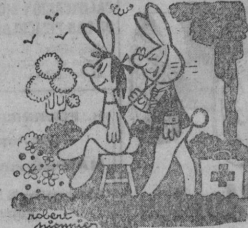
—Vamos, vamos... he dicho respire, no he dicho suspire...