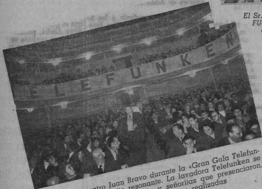
Un aspecto del teatro Juan Bravo durante la «Gran Gala Telefunken», que obtuvo un éxito resonante. La lavadora Telefunken se ganó la voluntad de las señoras y señoritas que presenciaron, asombradas, las demostraciones realizadas