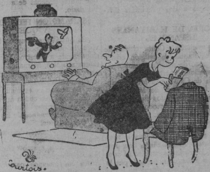
—Realmente, querida, la prestidigitación es algo que me entusiasma.

especiales para bares, comercios, oficinas, salas de espera iglesias, etc.: 820 pesetas CASA SOLERA. Corpus 7. Distribuidor de Gas Butano