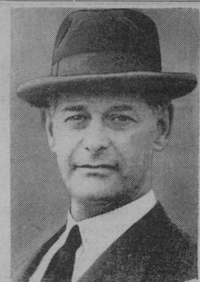
Keith Jack Holyoake, encargado de formar el nuevo Gobierno de Nueva Zelanda, después de la victoria de los conservadores

Barre (Vermont), 10.—La Policía del Estado ha informado que un gran avión se ha estrellado a unos ocho kilómetros, al este de esta localidad. Grupos de búsqueda y salvamento se dirigen hacia el lugar donde se cree ha caído el aparato.—Efe.