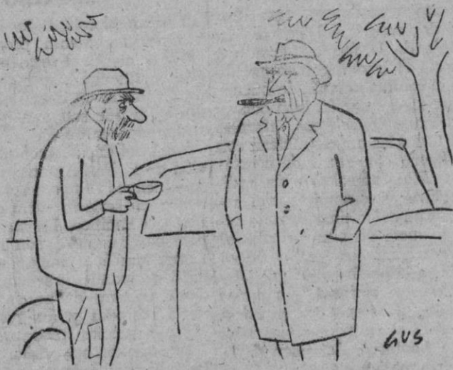
—Al menos, usted no tiene problemas!

Usted que distingue distingámonos con su elección